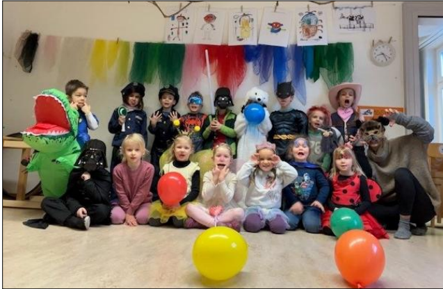
Die kunterbunte Fasnachtsschar.