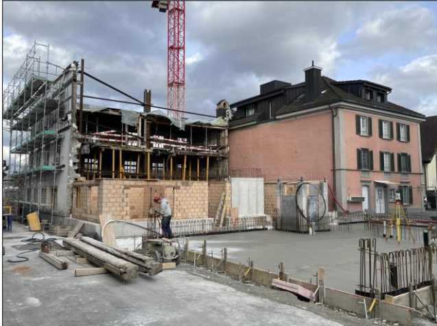
Bis Ende Februar waren die Bodenplatten bei der «Krone» fertig betoniert.