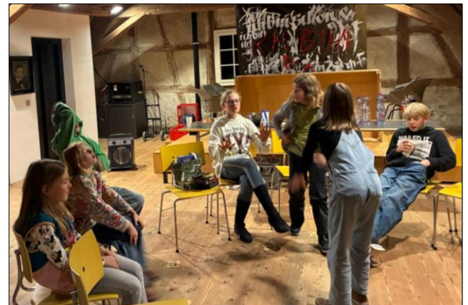
Auch die eine oder andere Runde Werwolf wurde im Bodmanhaus wieder gespielt.