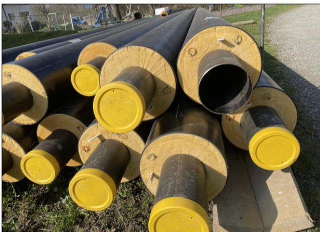
Die Hauptleitungen bestehen aus Stahlrohren, die sehr gut isoliert sind.

Die Wärme Gottlieben bedankt sich an dieser Stelle herzlich für die Unterstützung, das entgegengebrachte Vertrauen und das grosse Interesse am Projekt.