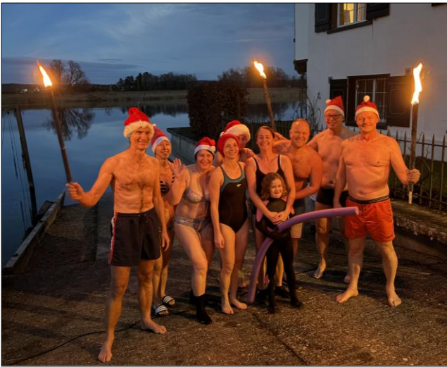
Die zehn Unentwegten im Fackellicht.