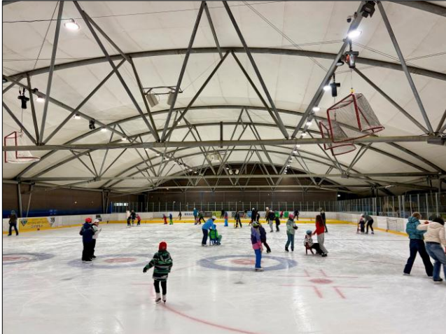
Das ganze Eisfeld nur für Gottlieben!