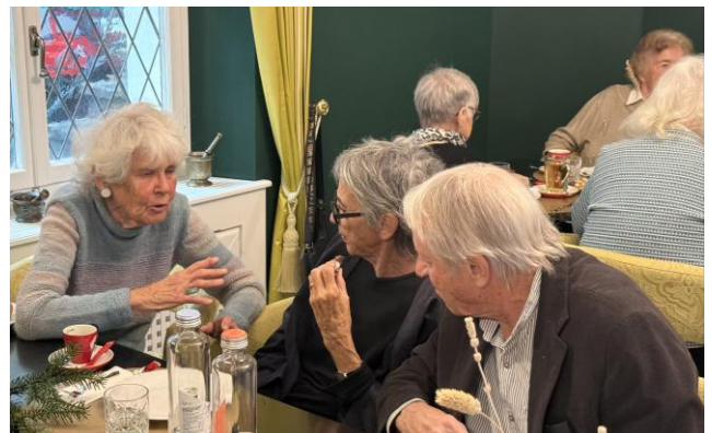
Engagierter Austausch unter den Senio- rinnen und Senioren Mehr Bilder unter: www.einwohnerverein-gottlieben.ch/gottlieber-senioren/

Die ersten Teilnehmenden zog's nach zwei Stunden nach Hause. Und wie immer – wenn sich erste verabschieden, löst das eine Kettenreaktion aus. Schnell entstanden Lücken. Wer traut sich, noch eine Runde sitzenzubleiben – vielleicht nächstes Jahr etwas länger? Uschi Marty